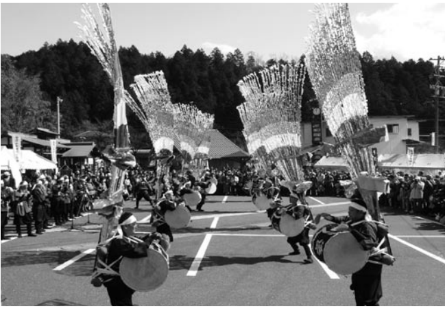
▲谷汲踊が披露されました。

また、期間中の土日には、谷汲踊やおぼ太鼓、三倉の太鼓踊り、春日上ヶ流太鼓踊り、東津汲鎌倉踊り、ふじはし権現太鼓の伝統芸能が披露され、訪れた観光客を楽しませていました。