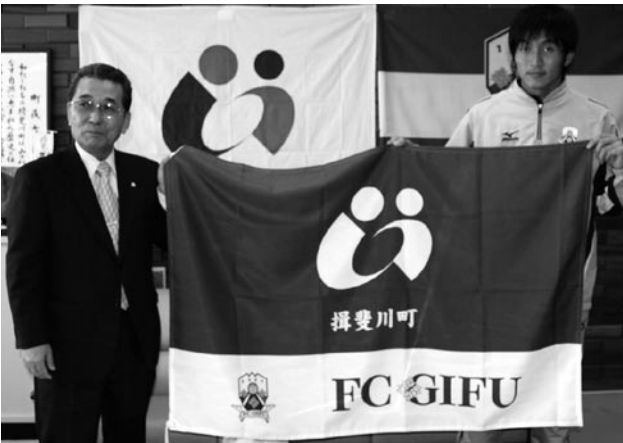
▲ホームタウンフラッグが披露されました。

ホームタウンフラッグは年間の試合日の中で各市町村の日を設け、試合会場に掲揚されます。今後もFC岐阜の活躍にご注目ください。