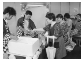
▲今年7月の揖斐高ショップ