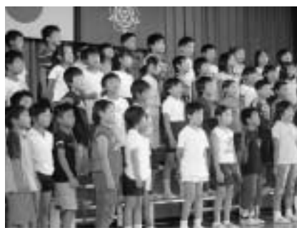
学校中に美しい歌声が響きます♪

揖斐小学校は、縦割りの「みどり班活動」を中心に仲間づくりをしています。五月の「仲良しウォーキング」は、一年生をお迎えする遠足です。一心寺、揖斐城趾、文学の道、健康広場を巡る六・五キロメートルのコースです。一年生にとってはなかなか大変です。「頑張つて、もう少しだよ。」と励まし合いながら歩きます。広場では班ごとに遊びます。仲間と励まし合いながらやり遂げることで、やさしさや友情を育てています。今年もみんなやさしさいっぱいになってくれると思います。