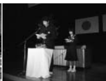
「私の夢」の朗読の様子★

次に、作文「私の夢」の朗読をしました。代表の揖斐川中・久瀬中の生徒が朗読し、作文をタイムカプセルに入れました。そして、7つの中学校による「走る川」を合唱し、249人の歌声が迫力あるハーモニーとなって大ホールを包み、素晴らしい歌声となりました。