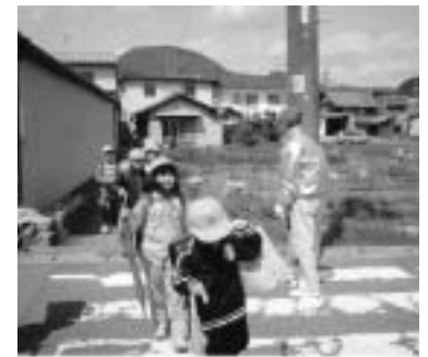
「おかえり。気をつけてね」

昨年度から本校では「あいさつボランティア」の募集をしています。朝夕の登下校時のあいさつと見送りをして頂いています。本年度は七間町の老人会「七福会」の皆さん二十人程が、地域の子どもたちは地域で守ろう、とあいさつと見送り活動をして頂けることになりました。おかげで子どもたちは昨年度以上に良くあいさつができるようになってきていますし、子どもたち