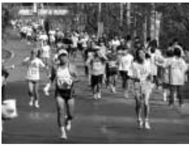
西平給水所を通過するランナー