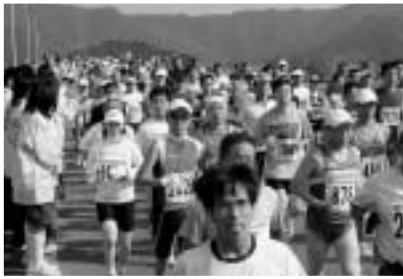
井ノ口橋は多くのランナーの足取りで揺れていました