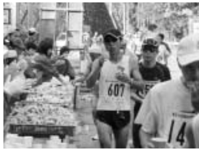
夕日谷給水所の軽食でスタミナ補給