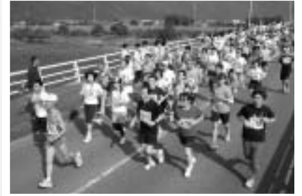
紅葉の川口橋を進むランナー