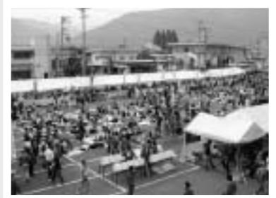
ゴールした選手たちを待つ表彰会場(揖斐川町中央公民館)