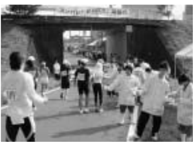
川口橋給水所付近では給水ボランティア、応援の方々がランナーを励ます