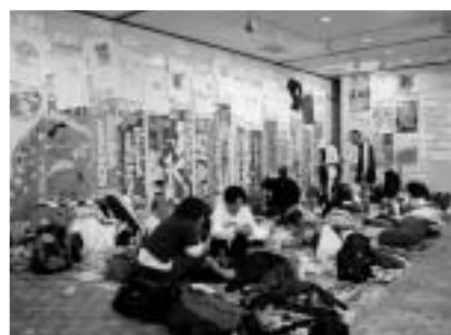
揖斐川町中央公民館のギャラリーもマラソン一色