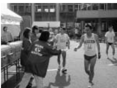
ゴールした選手たち