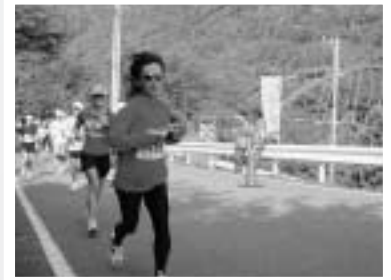
揖斐峡大橋を過ぎ揖斐川右岸をゴールへ向かう