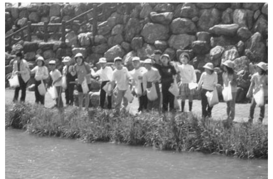
蛍がいっぱいいる町にしたいな \ (^o^)/

そのほか、三年生は、「桂のお茶工場の見学と茶摘み」を、五年生は、大光寺の長柄次郎さんに教えてもらいながら、「田植え」を体験しました。また、五年生は、一人一人バケツに苗を植えます。秋の収穫を今から楽しみにしています。