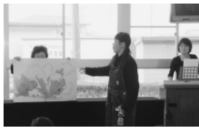
「人形劇同好会 パクパク」の皆さん