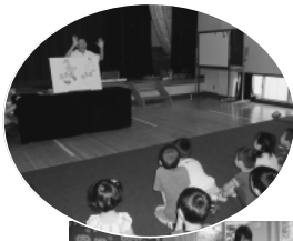
公民館 島よ 小で 7/8

この日は行事を行わず、利用者の交流を深めようという日です。また、10時45分からスタッフによる「お楽しみ」があります。短い時間ですが、遊びを楽しみながら、子育て術につなげてもらえたらとの思いで行っています。