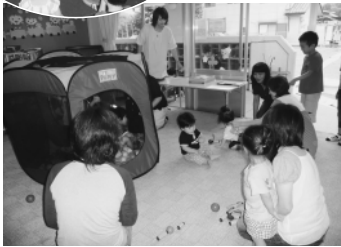
長瀬保育園でのようす 7/22