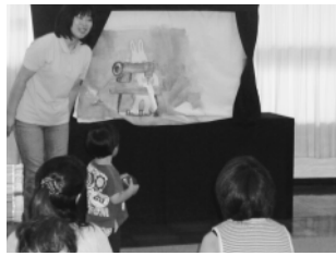
「お話の会 まど」の皆さん

毎月、地域のお話の会（ポランティア）の皆さんに、絵本や紙芝居、人形劇などの上演をしていただいています。親子でお話の世界を楽しみながら、心を豊かにしています。