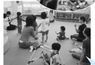
いろいろな手遊びを覚えました