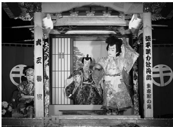
▲多くの観客を魅了した子供歌舞伎

5月4日（日）・6日（火）、揖斐川町三輪神社で、岐阜県重要民俗文化財に指定されている豪華絢爛な5輦の芸軸が曳き揃えられ、その芸軸の上での華やかな衣装で飾った稚児役者が見えを切る姿が披露されました。 揖斐祭りは30余年の歴史があり今年には下新町組の子どもたちにより『式三番叟と源平咲分牡丹島 重忠館の段』が上演されました。 両日とも天候に恵まれ、約4万5千人の観客が詰めかけ大盛況でした。