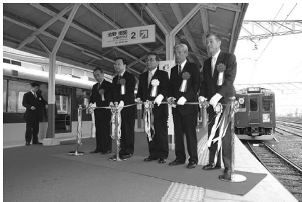
▲養老鉄道大垣駅で行われたテープカットの様子

揖斐駅前では、徳山ダムと谷汲山華厳寺などの町内観光スポットを周遊するバス「徳山ダム号」の出発式が行われ、セレモニーでは、出発を祝いテープカットが行われました。セレモニー終了後、小島幼稚園の園児の皆さんの鼓笛演奏にあわせ徳山ダム号が揖斐駅を出発しました。