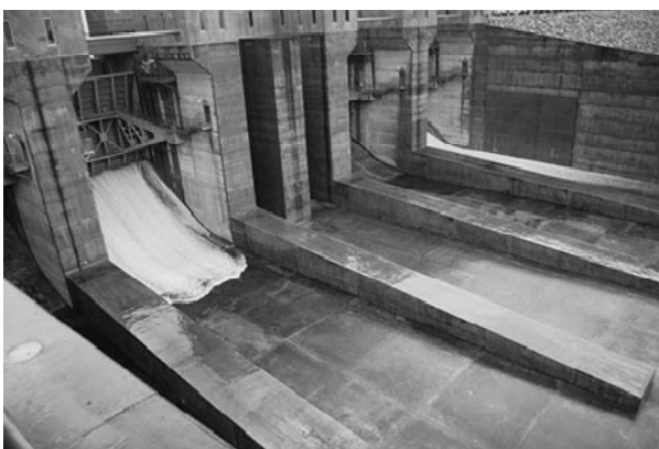
▲ゆっくりとゲートが開き、水が流れ始めたところ

平成18年9月25日から、試験湛水を行ってきた徳山ダムで、4月24日（木）試験放流が開始されました。 この日は、放流を知らせるサイレンが鳴り、洪水時などに非常用として利用される洪水吐きというゲートが開き、ダムに貯まった水の放流が開始されました。 この試験放流は、計画上の最高貯水位（標高401メートル）から、洪水期の最高貯水位である洪水期制限水位（標高391メートル）まで10メートル水位を低下させ、ダムや貯水池周辺の安全性を確認する目的で実施されました。