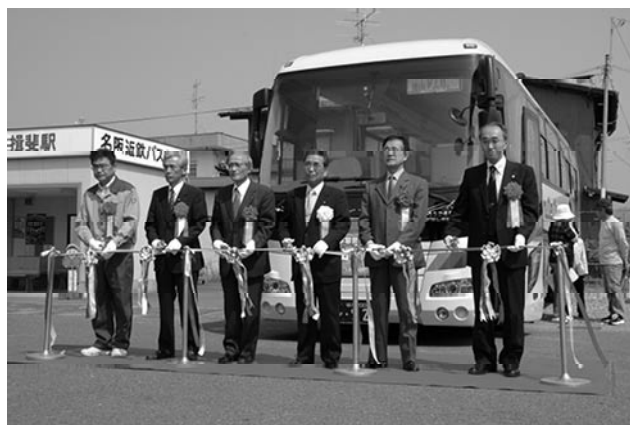
▲徳山ダム号の前でのテープカット（揖斐駅）