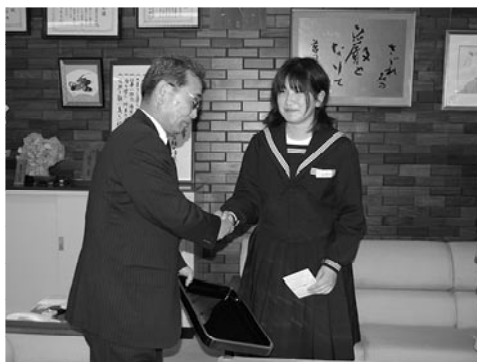
▲山田さん おめでとうございます。