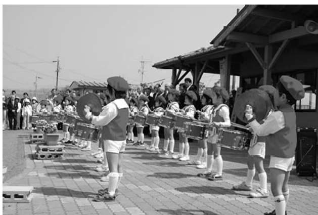
▲おじま幼稚園児による鼓笛演奏