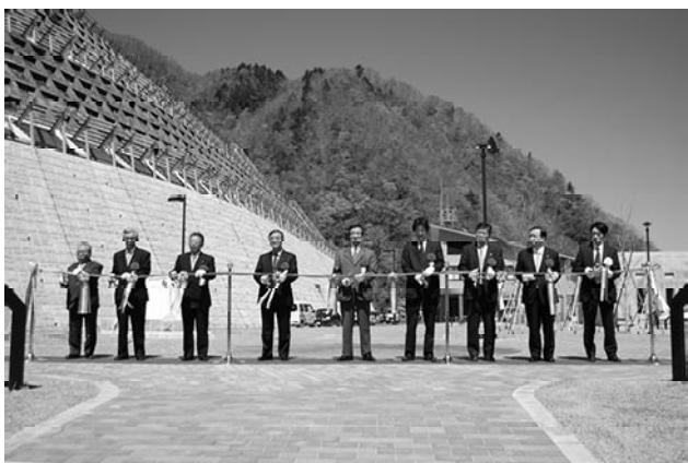
▲完成を祝い行われたテープカットの様子