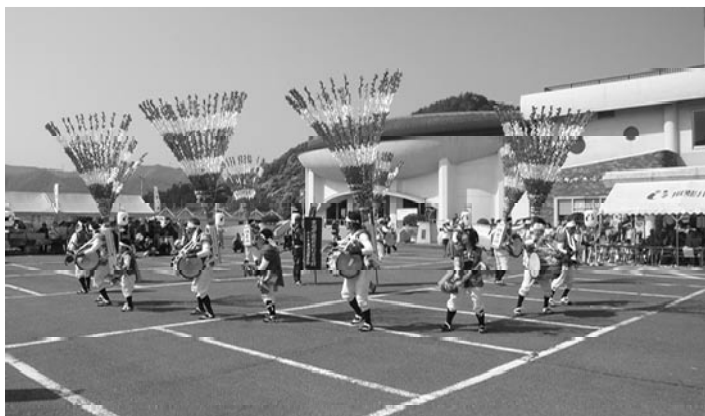
▲東津汲の鎌倉踊りの様子

揖斐川伝統芸能フェスティバルが、5月3日（土）、揖斐川町中央公民館で行なわれました。 伝統太鼓踊りでは、町内のそれぞれの地域の特色ある太鼓踊りなど6団体が集結し盛大に披露されました。また、中央公民館大ホールでは、子供歌舞伎が特別披露され、多くの皆さんが揖斐川の文化にふれあう機会となりました。 会場内では物産販売やバザーも行なわれ、多くの人でにぎわいました。