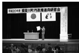
◀記念講演の様様(中央公民館大ホールで)(写真左)