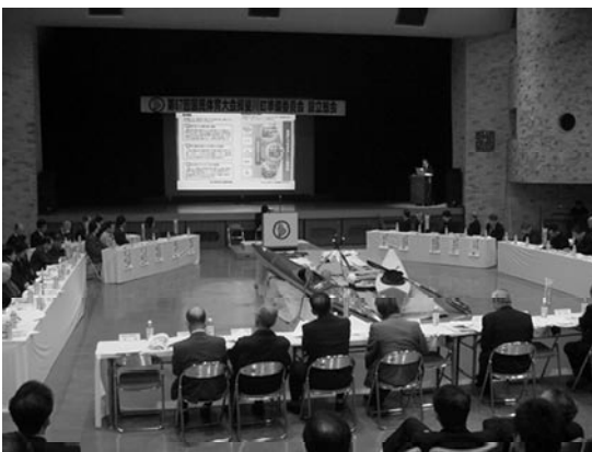
▲中央公民館で行われた総会の様子

第67回国民体育大会揖斐川町準備委員会設立総会が、3月21日(金)に揖斐川町中央公民館大ホールで行われました。 揖斐川町は、平成24年開催の国体においてソフトボール競技(少年女子)、カヌー競技(ワイルドウォーター、スラローム)を開催することが内定しています。これを受け、両競技の開催準備を行うため、各種関係機関・団体・地元組織の皆さん83人が集い、国体の成功にむけ準備委員会を発足し、町長を会長とした役員、開催基本方針などを決定しました。 今後、準備委員会では関係機関との協議をしながら準備を進め、先に町職員で組織した「ぎふ清流国体推進プロジェクト」で地域との関わりなどを検討していく事になります。