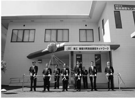
▲テープカットとくすだま開きの様子

平成17年度から進めてきた揖斐川町放送通信ネットワーク整備事業がこのほど完了し、3月31日(月)、竣工式が行われました。 放送通信センター前で行われたセレモニーでは、テープカットとくすだま開きで竣工を祝いました。 この事業で放送通信センター、光ファイバー182・3キロメートル及び同軸ケーブル267・9キロメートルなどが整備され、山間部では受信できない地上デジタル放送や高速インターネットが利用できる環境が整備されました。今後、この施設を活用し、地域に密着した情報を提供していきます。