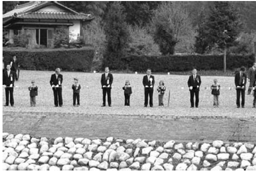
▲参加者全員によるテープカットの様子

この事業で流下能力の向上と治水安全度が高まり、安心して暮らせるまちづくりにつながりました。