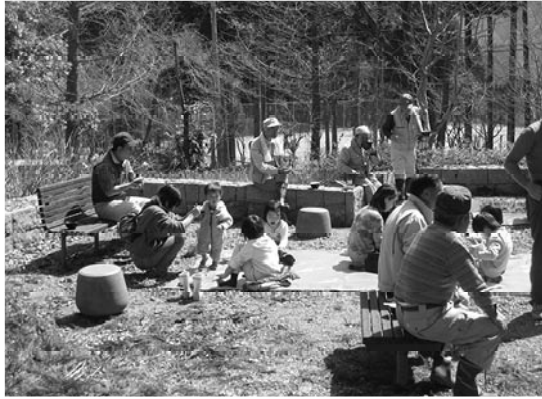
▲都市住民と交流している様子

山の幸を活かした地域づくりに取り組む「山菜の里いび」は、春日美東の「長者の里」に隣接する耕作放棄地約20アールを都市住民と協働で山菜農園へ再生する活動に取り組んでいます。昨年11月に行われた第1回目の活動では、背丈以上に伸びたカヤが刈り取られ整地されると、耕作放棄地は見違えるほどきれいになりました。3月22日に第2回目が行われ、獣柵の設置と定植に汗を流しました。作業後には、沢あざみの混ぜご飯や団子汁などを食べながら、山菜農園完成の夢を語り合いました。