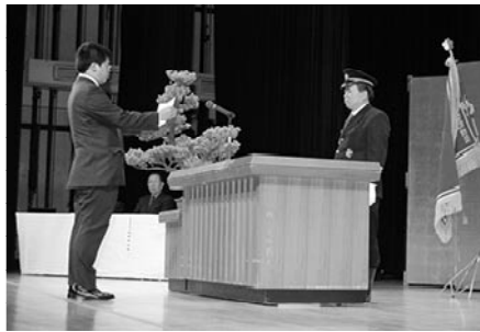
▲新入団員代表による宣誓の様子