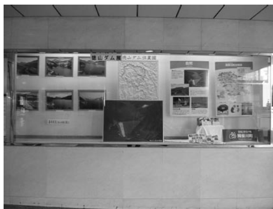
▲展示された写真や観光案内など

3月18日(火)から4月中旬にかけて、東京都港区六本木にある「ラピロス六本木」の1階展示ブースで徳山ダムの写真の展示を行いました。