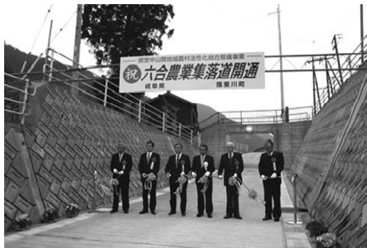
▲テープカットで開通を祝いました。