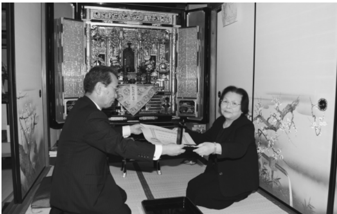
▲叙勲の伝達の様子

これらの生前の功労が認められ今回の叙勲の受章となりました。この多大な功績に対し、敬意を表しますとともに心からご冥福をお祈りします。