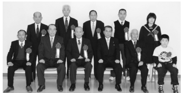
▲表彰を受けられた皆さん(写真上)