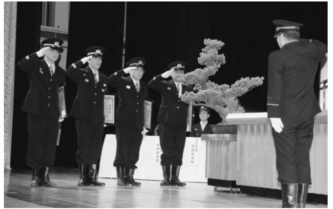
▲町長特別感謝状を受けられた皆さん