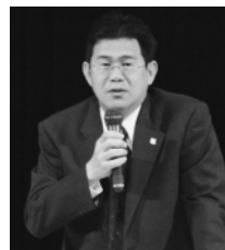
◀講演の様子(中央公民館大ホールで)(写真左)