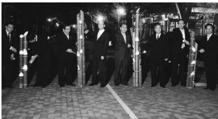
▲点灯式の様子(谷汲山門前参道にて)

谷汲門前街並づくり委員会は、観光客を増加させ地域の活性化を図ろうと様々な取組みを行っています。 毎年、桜の開花に合わせて、観光客の皆さんに喜んでもらうため、手作りの行燈や竹灯籠約750基を参道沿いに設置されました。 3月27日(金)には、竹灯籠点灯式が行われ、この日から谷汲山参道の桜のトンネルが、ほのかな灯りで演出されました。