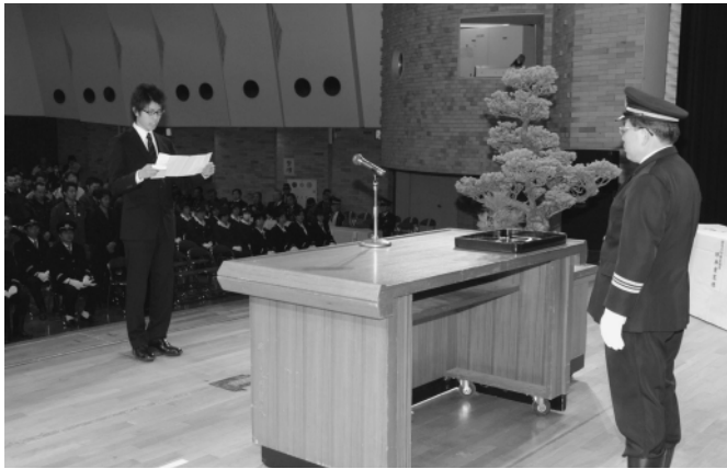
▲新入団員代表による宣誓の様子