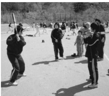
▲実技講習会の様子