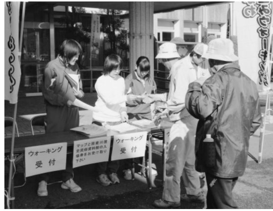
▲元気いっばいに活動する会員