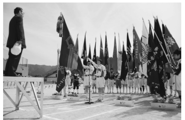
▲力強い選手宣誓が行われました

人材バンクに登録された皆さんには、地域の活動情報を定期的に郵便やメールでお知らせし、その中で参加したい活動を選び、ボランティア活動に参加していただきます。 人材バンク登録希望者の年齢制限などは特ありません。 詳しい内容は社会教育課(☎2310115)まで。