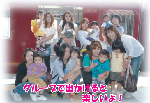
グループで出かけると 楽しいよ！