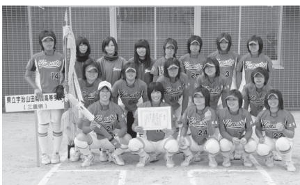
▲優勝校 宇治山田商業