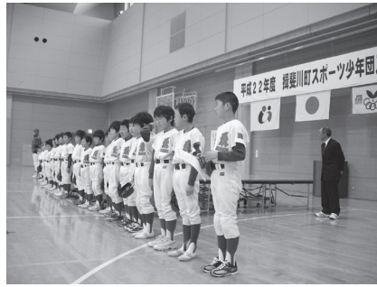
団のきまりを斉唱する清水野球少年団