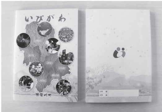
▲社会科副読本「いびがわ」