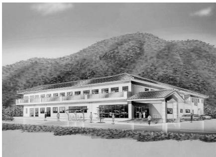
▲揖斐川尚和園完成予想図