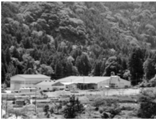
▲いび森林資源活用センター