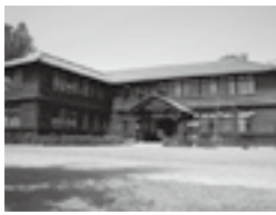
日本昭和村 やまびこ学校

12月～平成23年2月まで、入園料が半額になります。クリスマスのナイター営業(予定)やお正月イベントなど、楽しさ盛りだくさんです。※年末年始も休まず営業します。