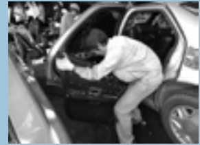
企業での実習風景

企業の皆さんには、企業内作業学習・職場実習の目的をご理解いただき、障がいのある生徒の受入れに、ぜひご協力をお願いします。