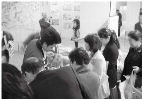
揖斐高ショップ 大盛況に大忙しの揖斐高生

青少年の健全な育成を願い、揖斐川町青少年育成町民会議主催による、「平成22年度揖斐川町青少年育成町民大会」が11月28日(日)に、岐阜県青少年健全育成県民大会と共催で開催されました。各種表彰、青年ニューヨーク遊学発表、少年(補導)センター部会報告に引き続き、揖斐川町青少年育成町民会議および3部会の活動報告を行い、町内をはじめ県内各地からの参加者に、町民会議の活動とその成果を理解していただくことができました。 また、開会前には揖斐高等学校と揖斐川中学校の吹奏楽部による歓迎演奏、閉会後には揖斐高等学校の生徒による「揖斐高ショップ」の開催により、大会に花を添えてもらいました。さらに中央公民館ロビーでは各地区公民館活動、各小中学校PTA活動のパネルや大和地区安全マップ、家庭の日ポスターなどの展示があり、訪れた人の目を楽しませていました。