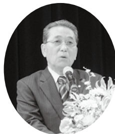
歓迎の言葉を述べる宗宮町長