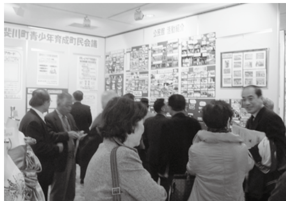
ロビーには各地区公民館・PTAの活動紹介 パネルなどを展示