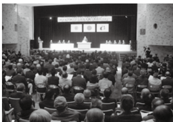
満員となった会場