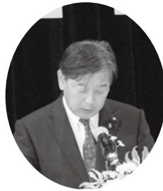
開会の言葉 宗宮町議会議長