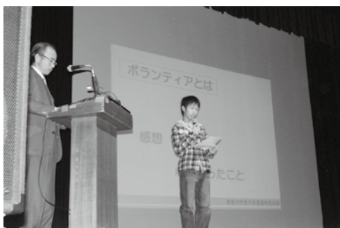
ボランティアへの思いを高校生に話してもらいました

青少年を地域社会の一員として考え行動できる「地域社会人」を育てることを目標として、大人から意図的に「青少年の活動の場」を創出していくことを働きかけています。子どもたちへの「ボランティアカード」の配布とともに、ボランティアを募集する団体等にボランティア依頼の基本パターンや「ありがとうポスター」の作成・掲示について提案してきました。さらに多くの皆さんへ周知をし、ボランティアをきっかけとした地域の活性化・地域づくりへの発展を期待して活動を継続していきます。