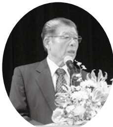
主催者挨拶 青少年育成県民会議会長