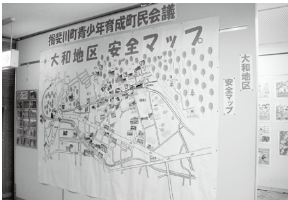
大和地区の安全マップ、今年も大作です！