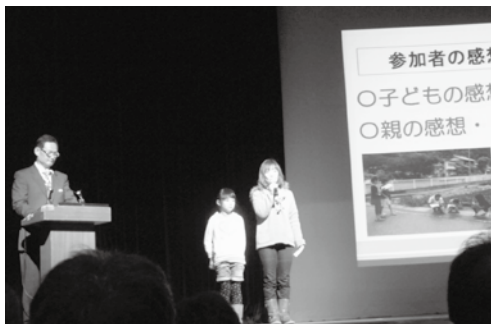
安全マップ作りの体験を話してもらいました

安全で安心して生活できる環境づくりを目指し、「安全マップの作成」「あいさつ運動」に取り組んでいます。「安全マップの作成」については、子どもたち自身が地域へ出かけて自分の目で危険箇所を確認し、危険を回避する力を身につけることを目的として作成しました。「あいさつ運動」については、学校安全サポーターや環境部会のメンバーが地域の大人に働きかけ、地域全体であいさつが行われるよう取り組みました。このように、子ども達をとりまく環境・情報を地域で共有し、よりよい環境づくりに役立てていきます。