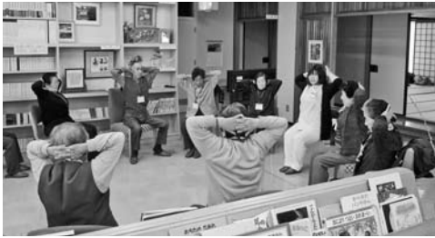
▲介護予防教室の様子

揖斐川町地域包括支援センターでは、介護相談をはじめ、介護予防についての教室も行っていきますので、お気軽にご相談ください。