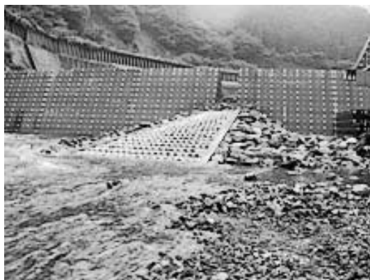
▲坂内川に造った貯砂堰と魚道

・ 生命・財産をしっかりと守り、更なる安全のため、ダム湖に洪水を貯めるための容量を大きくしました。