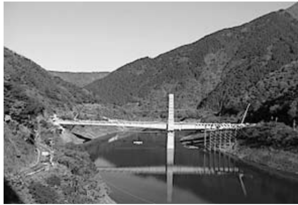
▲横山ダムから見た「奥いび湖大橋」