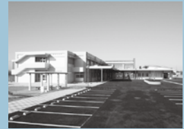
可茂特別支援学校(美濃加茂市)

県教育委員会では、「子どもかがやきプラン」に基づき、障がいのある子どもたちが地域で育ち、学べるよう、特別支援学校を地域ごとに整備しており、4月には可茂地域に特別支援学校を開校します。