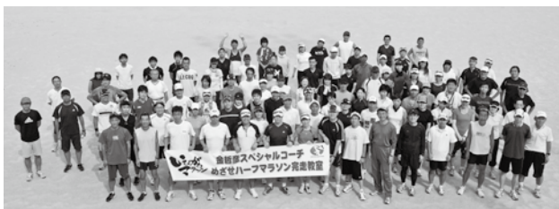
大会ホームページ「教えて!金コーチ」 毎月、金コーチからアドバイスが配信されます

今年で5年目を迎えるマラソン教室!今、陸上界で大人気の金コーチがあなたをゴールへと導いてくれます。