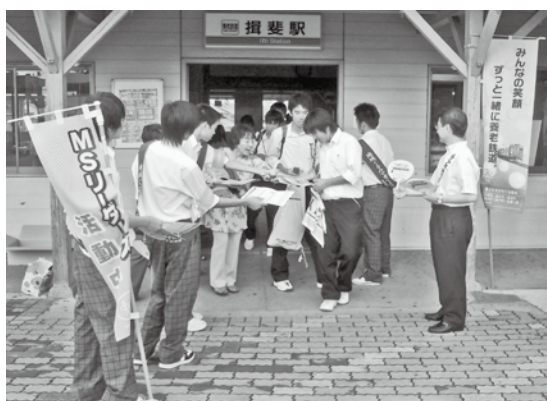
▲養老鉄道揖斐駅前での街頭啓発の様子

私たち住民一人ひとりが関心を持ち、それぞれの立場で関っていくことで非行や犯罪のない明るく住み良い地域にしていきましょう。