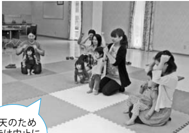
— 春日保健センター —

公民館への出前保育では散歩に出かけ、地域の様子を見て歩きました。幼稚園では、遊びを通して園児とのふれ合いを楽しみました。