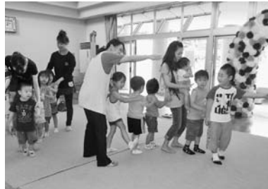
— くぜ幼稚園 —