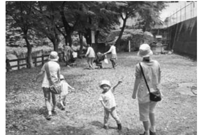
— 藤橋コミュニティー —