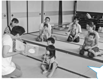
— 大和公民館 —