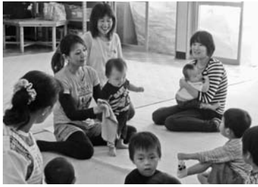
— きたがた幼稚園 —

各地域に出前保育に出かけ、未就園児親子の皆さんを対象に遊びと相談の場を設けています。ご利用ください。(時間：9時30分～11時30分)