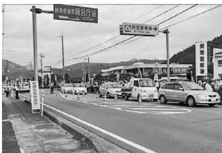
▲交通安全指導所で安全運転啓発 (揖斐警察署前にて)

7月11日(月)と12日(火)に、夏の交通安全県民運動に併わせ、町内の小中学校通学路や事故の多発している交差点で、交通安全を呼び掛ける街頭啓発活動等が行われました。11日は、町役場全職員と揖斐署が町内各所で街頭啓発を実施しました。12日には、揖斐署、交通安全協会、交通安全女性、揖斐建設業協会、揖斐地区砕石事業者など約50人が参加して、揖斐警察署前の国道で、交通安全指導所が設置され、ドライバーに交通安全啓発グッズを手渡し、安全運転を呼びかけました。揖斐署管内では、昨年交通事故が多発し、様々な取り組みを行ってきました。今後も、安心安全なまちづくりのために、町全体で交通安全を推進していきます。