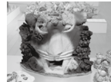
大地の子どもたち 2005 出品作品

県下の小・中・特別支援学校等でつくられた「やきもの」作品を展示し、その魅力を紹介します。8 月 28 日 (日) まで 料金 / 無料