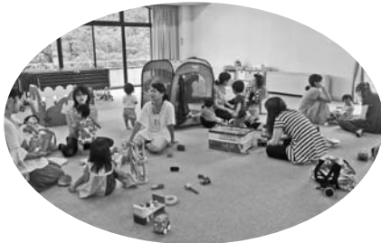
— 谷汲保健センター —

各地域に出前保育に出かけ、未就園児親子の皆さんを対象に遊びと相談の場を設けています。ご利用ください。(時間：9時30分～11時30分)