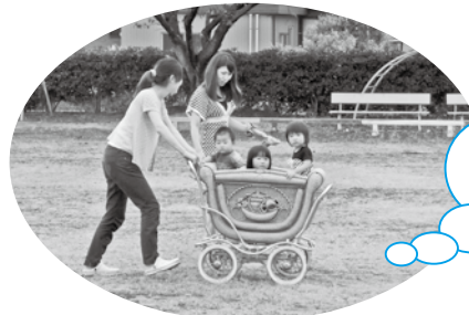
グラウンドで楽しそうに遊ぶ親子

草刈りなど、地域のボランティアの方がいつも整備してくださるおかげで、戸外でのびのびと遊ぶことができます。ありがとうございます。