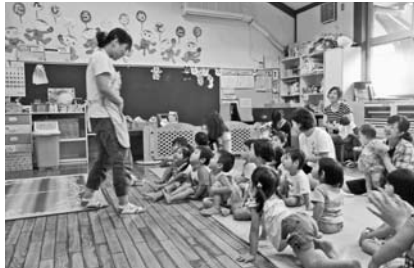
— 養基保育園 —