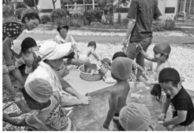
— きよみず幼稚園 —