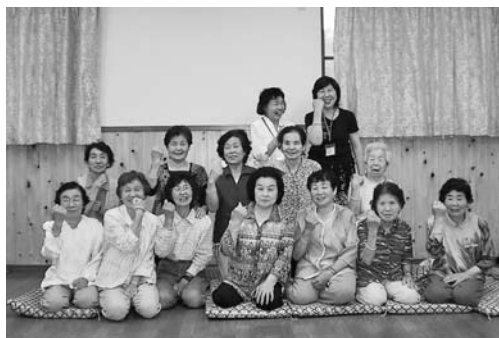
▲認知症サポーター養成講座参加の皆さん(谷汲深坂)