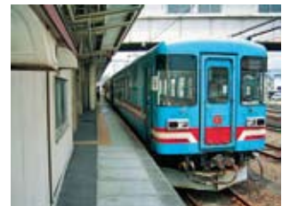
揖斐川町・樽見鉄道㈱