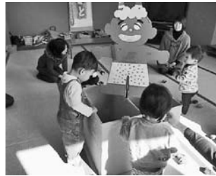
— 清水公民館 —