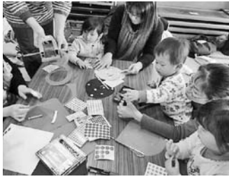
— 大和公民館 —