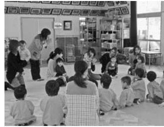
— きたがた幼稚園 —

公民館では正月の行事に因み、親子で凧やコマ作り、節分の行事では鬼の面を作ったり豆まき遊びを楽しみました。幼稚園では入園を間近にして園の様子を聞いたり、園児の様子を興味深げに見入る親さんの姿が見られました。