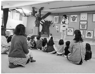
— いび幼稚園 —