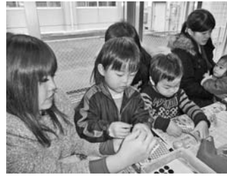
— 小島公民館 —