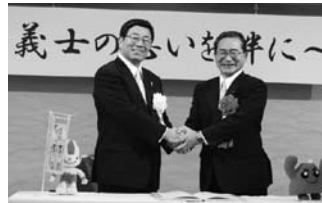
握手を交わす両県知事

両県は直線距離で700km以上離れており、同時に被災する可能性が低いことから、昨年11月に「災害時相互応援協定」を締結し、どちらかの県で災害が発生した場合、もう一方の県が迅速かつ集中的に支援することとしました。