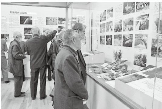
▲展示に見入る参加者