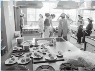
ボランティアさんとおしゃべりをしながら、楽しく調理実習をしました。 【胄永公民館】