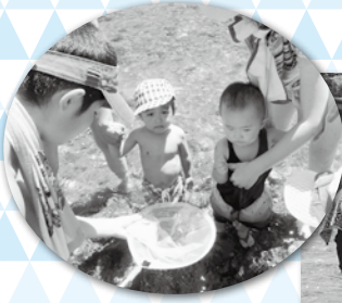
谷川の冷たさや川の流れを体感したり、石を投げて音を楽しんだりして遊びました。 【坂内ふるさと福祉村】