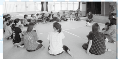
園で遊ばせてもらうことにも慣れ、のびのびと遊ぶ姿が見られました。 【やまと幼稚園】