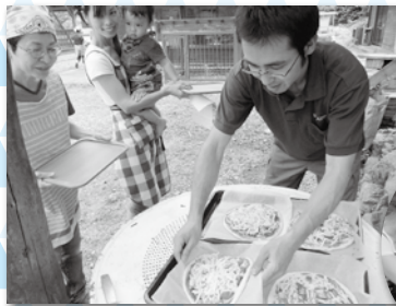
久瀨小津地域で、ピザ作り体験をしました。窯に入れるといい匂いが漂ってきました。 【久瀨月夜谷の里】