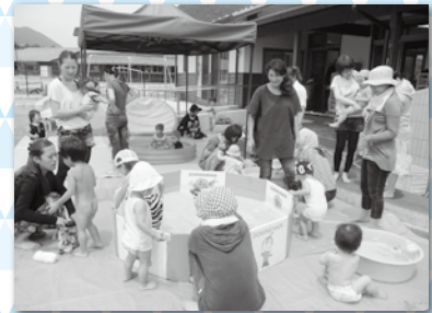
水遊びやシャボン玉、スライムなどをして、大胆な遊びを楽しみました。 【たにぐみ幼稚園】