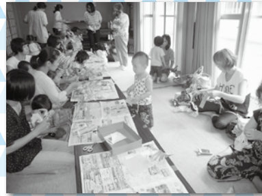
七夕飾り作りをしました。オリジナルの飾りを作るママもいて、工夫する楽しさも味わいました。 【小島公民館】