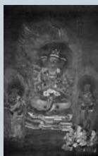
国宝 絹本着色五大尊像 のうち降三世明王像 (来振寺蔵)

山田貢 一越縮緬訪問着 「ながれ」1957年 (世田谷美術館蔵)