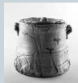
荒川豊蔵「志野水指」 1938-41年

多治見市東町4-2-5 ☎0572(28)3100 休 / 月曜日 (祝日の場合は翌平日) 開館時間 / 10:00 ~ 18:00