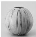
林恭助「黄瀬戸壺」 2009年

9月1日(土) ~ 11月11日(日) 観覧料 / 一般500円 大学生400円