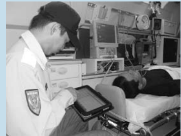
配備されたタブレット端末を使う救急隊員

員がタブレット端末を使って直接入力することで、情報が随時更新され、他の救急隊員がそれらの最新情報を現場で即、利用できるようになりました。救急隊員は医療機関ごとの最新の搬送情報を即時に把握し、患者の搬送先を検討・確認できます。