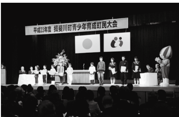
▲昨年の青少年育成町民大会

平成24年度 揖斐川町青少年育成町民大会 開催のお知らせ ■日時 12月2日(日) 13時30分～15時30分 ■場所 揖斐川町中央公民館 大ホール ■内容 ・揖斐川町青少年育成町民会議 実践発表 ・町民会議全体の取組 3部会 (青少年、家庭、環境)の取組 ・小学生県外派遣報告 ・揖斐高校MSリーダーズ活動報告等 【お問い合わせ先】 教育委員会社会教育文化課 TEL 22-2111 (内線472)