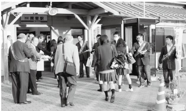
▲揖斐駅での街頭啓発

この活動は、青少年育成推進員・保護司会・更生保護女性会のみならずに加えて、県立揖斐高校のMSリーダーズのみなさんが、啓発用品などを配布し、運動を呼びかけました。この活動を機に、青少年の社会での自立、生活習慣の見直しを促し、青少年を犯罪や有害環境等から守るための取り組みを続けていきます。