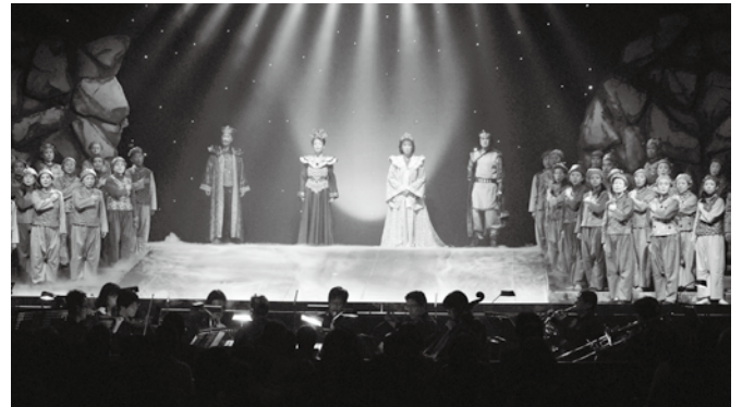
▲創作音楽劇「夜叉ヶ池八丈岩物語」

美術の部、文芸の部では、審査が 行われ、上位入賞者に次の皆さんが 選ばれました。