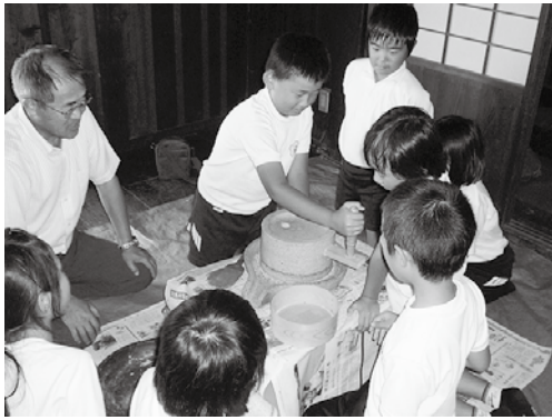
▲石臼でのきな粉づくり体験

子どもたちは、珍しい体験に目を輝かせて一生懸命に取り組んでいました。また、昔の道具に触れてみたりスケッチをしたりして、昔の生活を学んでいました。