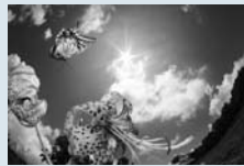
キアゲハ

関市小屋名 1989 (百年公園内) ☎ 0575(28)3111 休 / 月曜日 (祝日の場合は翌平日) 開館時間 / 9:30～16:30