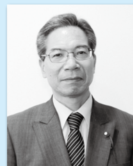
お お く ぼ た め よ し 議員 大久保 為芳 議員 (春日)