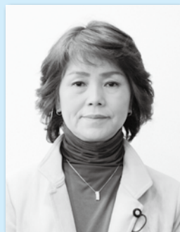
お お に し け い こ 議員 大西 恵子 議員 (揖斐川)