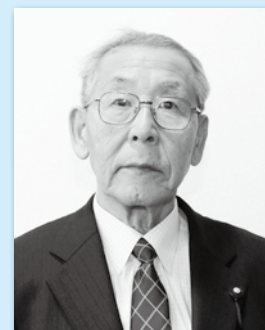
も り た い ろ う 議員 森 泰朗 議員 (春日)