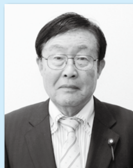
に し き の え つ ろ う 議員 錦野 悦朗 議員 (揖斐川)