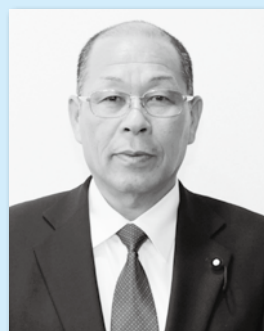
む ら せ さ ぶ ろ う 議員 村瀬 三郎 議員 (揖斐川)