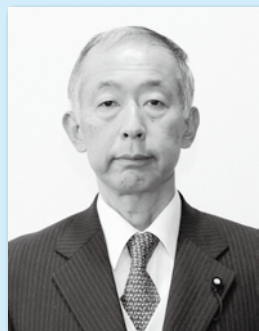
う さ み な お み ち 議員 宇佐美 直道 議員 (揖斐川)