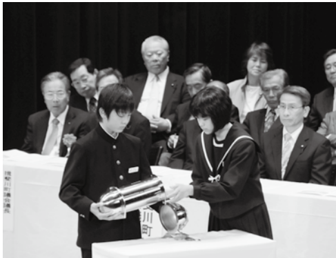
タイムカプセル投入の様子

司会者をはじめ、各中学校の代表者を中心となり、生徒の皆さんが、厳粛な雰囲気の中で、志を高められた、すばらしい式典となりました。今後も、学生生活を充実させ、揖斐川町で活躍をしていただけることを期待しています。