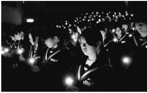
キャンドルセレモニーの様子