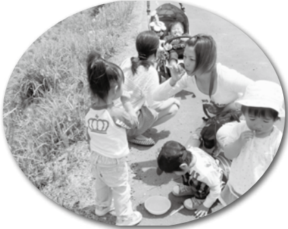
公民館で遊んだ後、周辺の散策に出かけ、タンポポの茎でシャボン玉をしたりして遊びました。