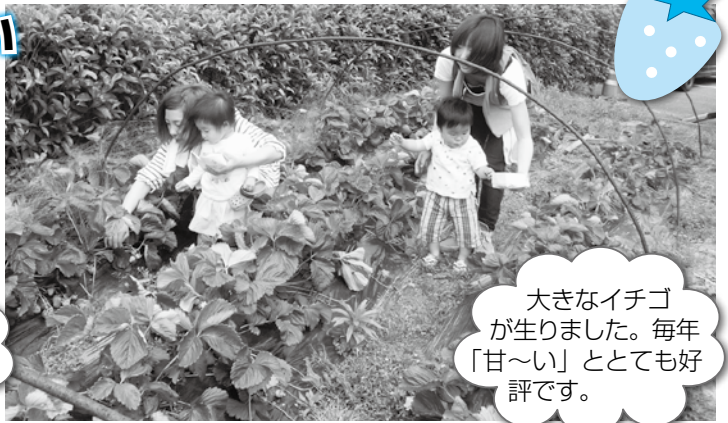
大きなイチゴ が生りました。毎年 「甘〜い」ととても好 評です。

花モモ農園では 一年を通して様々な収穫体験ができます — 地域の方が、畑を守ってくださっています —