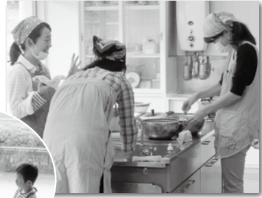
地域の方と一緒に料理教室をしました。子ども達は、ボランテニアさんに遊んでもらいました。