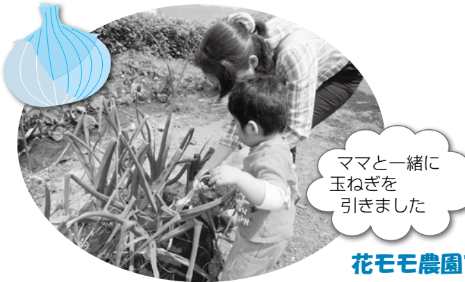
ママと一緒に 玉ねぎを 引きました