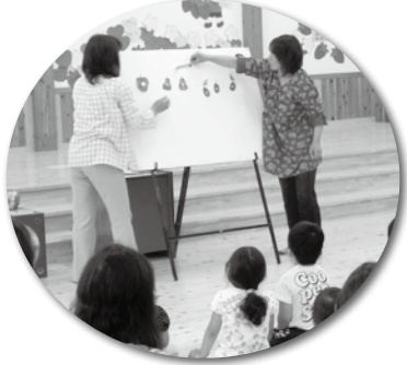
園児と一緒にお話を聞いたり、リズム遊びを楽しんだりしました。