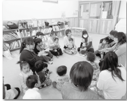
園児と一緒に「かえるがゲコゲコ」などの歌に合わせて、ふれあい遊びをしました。