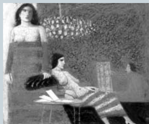
佐々木豊 「アトリエにて」 (2006年) 画布にクレパス 38.5×45.5cm 笠間日動美術館所蔵

岐阜市宇佐 4-1-22 ☎058(271)1313 休 / 月曜日 (祝日の場合は翌平日) 開館時間 / 10:00 ~ 18:00 企画展開催時の第3金曜日は夜間開館日 10:00 ~ 21:00 ただし入場は 20:30 まで