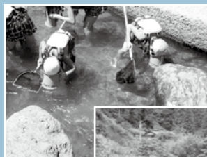
川の生きもの観察