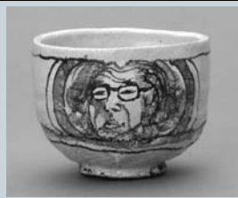
日根野作三「自画像茶碗」 多治見市美濃焼ミュージアム蔵

岐阜県現代陶芸美術館 多治見市東町 4-2-5 ☎0572(28)3100 休 / 月曜日(祝日の場合は翌平日) 開館時間 / 10:00 ~ 18:00 (入館は 17:30 まで)