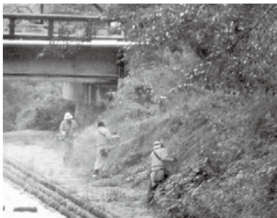
朝鳥公園清掃活動の様子