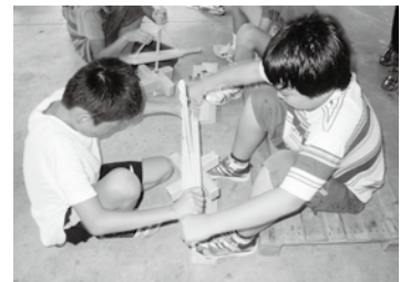
火おこし体験の様子