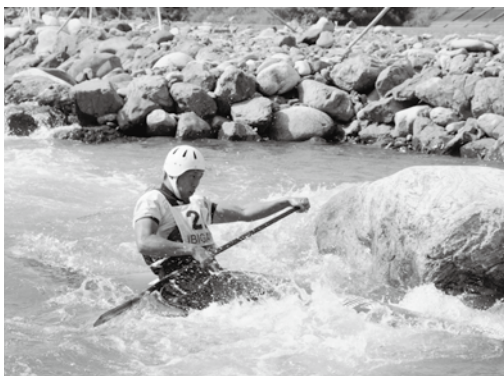
カヌーシラローム競技の様子

両日とも晴天に恵まれ、参加した選手達は華麗なパドルさばきで清流揖斐川の流れと一体となって練習の成果を競い合いました。また、今回の大会でも町カヌー協会のメンバーが審判員として活躍され、競技運営を支えました。