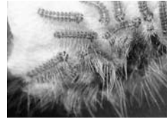
マイマイガの幼虫

卵は毛布をかぶせたように褐色の細毛で覆われているので、殺虫剤の効果は期待できません。壁を傷つけないようあまり硬くない、先が平らなものでこまめに剥がして卵塊を取り除いてください。