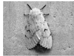
マイマイガの成虫

今年の夏に大量発生したマイマイガの対処方法として、成虫になると駆除が困難となりますので、卵や小さい幼虫の時期に駆除することが発生を防ぐ有効な手段となります。