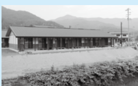
建設が進んでいる災害公営住宅

震災から2年以上が過ぎた現在、大槌町では、仮設住宅や仮設店舗といった「仮設」の形態ではなく、「本設」としての住居の建設が、津波による浸水被害を受けなかった地域で集中的に続いています。仮設住宅に代わる災害公営住宅も建設されており、今後、仮設住宅から一戸建て住宅や災害公営住宅に移り住むことで、仮設住宅は段階的に廃止される予定になっています。