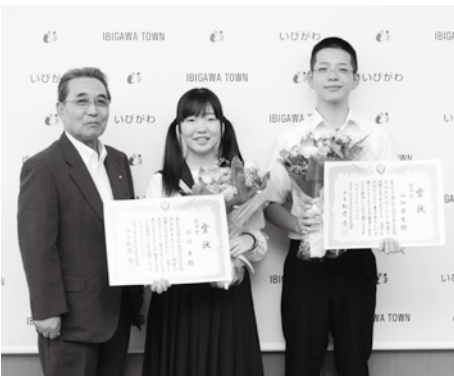
受賞おめでとうございます。

宗宮町長は、「受賞おめでとう。自分の家族や地域を大切に、自分の夢に向けてさらにがんばってほしい。将来は、町を担う力になってくれることを期待しています。」と受賞を称えました。