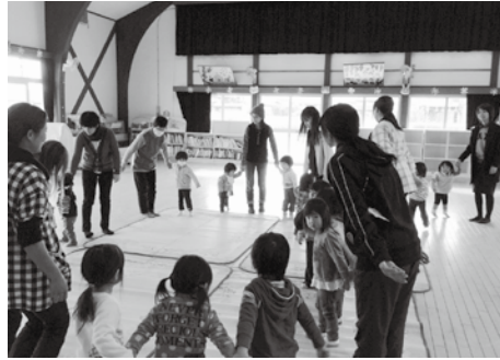
園児と一緒にクリスマスの話を聞いたり、みんなでフォークダンスを踊ったりしました。