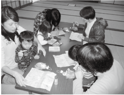
クリスマス会で、花紙を使ったサンタクロースを作りました。