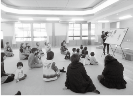
園児と一緒に遊んだり、クリスマスの話を聞いたりしました。