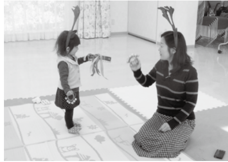
クリスマス会で、パネルシアターを見たり、楽器遊びをしたりしました。参加者は少なかったのですが、親子とじっくりと関わることができました。