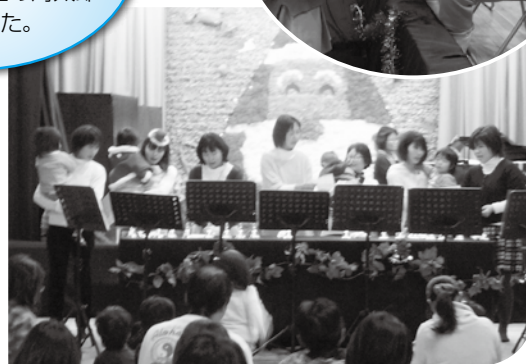
月の行事「音楽のひろばハーモニー」に参加してきたママたちが、ハンドベルでクリスマスソングを演奏しました。