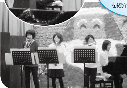
サークル“ママカルテット”が、各自の楽器を持ち寄って活動してきた成果を発表しました。