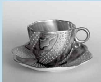
コールポート 《金彩ジュエルめうの様様カップ&ソーサー》

多治見市東町4-2-5 ☎0572(28)3100 休 / 月曜日(祝日の場合は翌平日) 開館時間 / 10:00~18:00(入館は17:30まで)