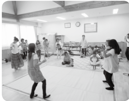
園児と一緒に手遊びやダンスをしてふれあい遊びを楽しみました。 【6月25日 きたがた幼稚園】