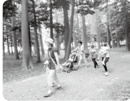
北方神社を通りぬけ、地域の方と話をしたりして、のんびり散歩を楽しみました。 【6月4日 北方公民館】