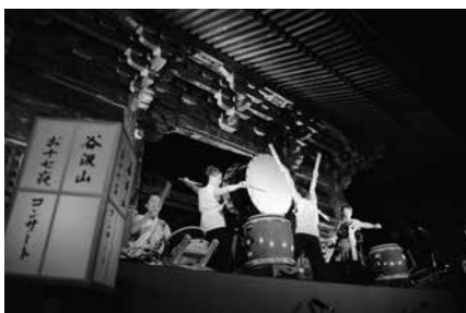
▲昨年のお十七夜コンサート