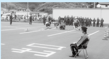
消防操法大会の様子

震災当時、陸前高田市の人口は2万4千3百人ほど。千7百人を超える方が犠牲となり、その中には消防団員51名が含まれます。震災で生き残った団員や震災後に入団した団員の中には、仮設住宅での暮らしが長引き、生活再建の先も見えない方もいるはず。住民の命を守っていくその覚悟も含め、団員一人一人が背負うものもとても重く、競技大会での真剣な眼差しがそれを物語っていると感じました。震災で犠牲になられた団員の方々の遺志を継ぐことは大変ですが、競技会を通じて、火災から地域を守るその決意を新たにしたことと思います。