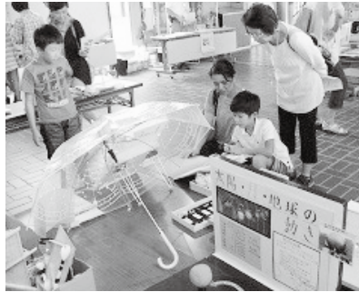
平成25年度池田町会場