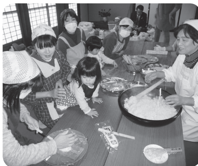
地域の方に五平餅の由来を聞きながら、親子で楽しんで作る事が出来ました。 【11月10日 坂内ふるさと福祉村夢想庵】