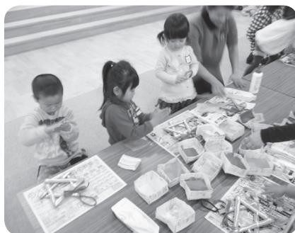
全園児と体を動かしたり、クリスマスリース作りを楽しみました。 【11月26日 かすが幼稚園】