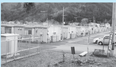
今も多くの方が暮らす仮設住宅

前回報告 しました「小中一貫校建築工事」は無事落札しました。平成28年2学期の開校を目指し工事が始まります。