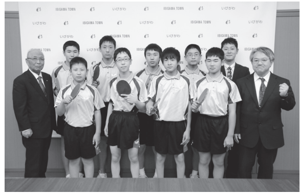
【第9回東海中学校選抜卓球大会】 北和中卓球部