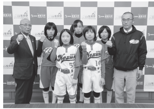
【第24回東海地域小中学生 岐阜NEXUSソフトボール新人大会】 ソフトボール新人大会 (中学生)