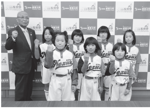
岐阜NEXUSジュニア(小学生)